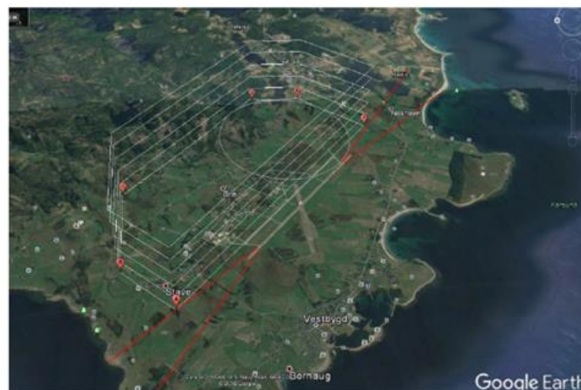
Figure 2. Fareområdet projisert fra bakken for hver 250 meter. Øverste linje er på 4000 fot / 1219 meter.